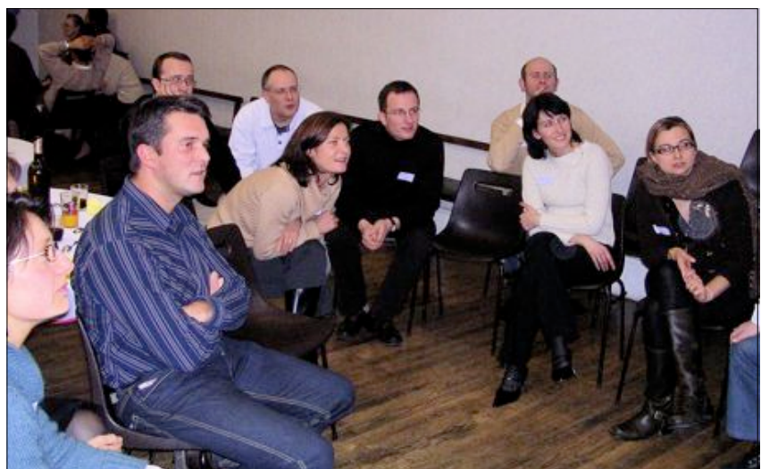
Dîner Jeunes Professionnels